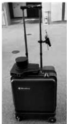
AIスーツケース。 とても頑丈そうです。