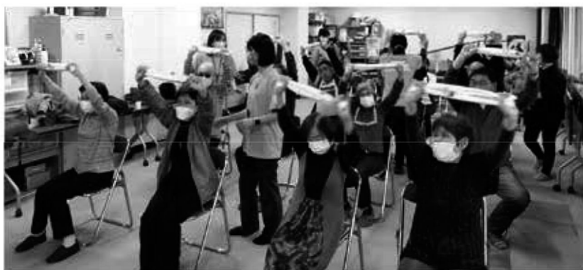
フレイル予防体操。

昼食は音声ガイド電子レンジを 使用し、冷凍弁当を解凍し試食。 今後の冷凍食品の活用に期待。