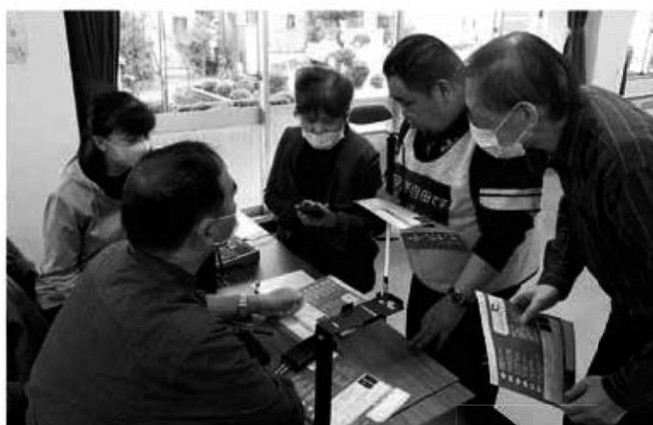
視覚障害者便利用具の説明を聞く。

昼食は音声ガイド電子レンジを 使用し、冷凍弁当を解凍し試食。 今後の冷凍食品の活用に期待。