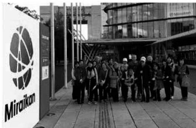
日本未来館にて集合写真。