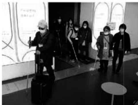
AIスーツケース体験の様子。