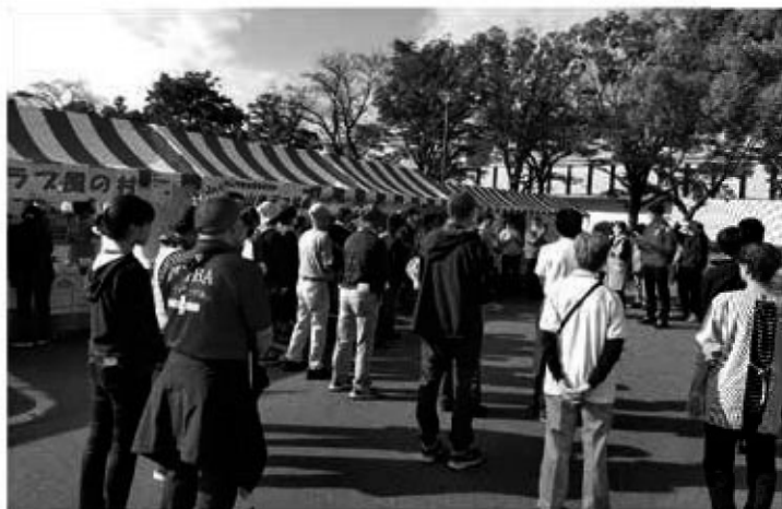
福祉会場の朝礼の様子。秋の空がとてもきれいです。