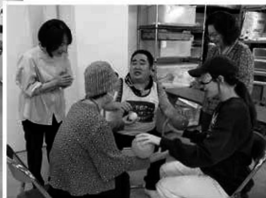
東京理科大学学生さんとのレクリエーション。 学生さんはアイマスクをしています。