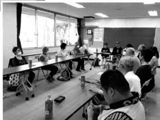
東京理科大学学生ボランティアサークルさんと会談の様子。