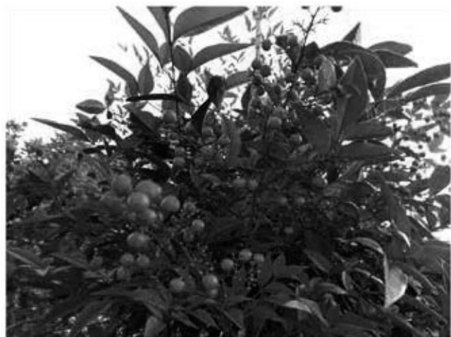
冬の寒い空に南天の赤い色がよく映えます。