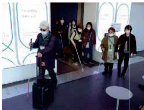
AIスーツケース体験の様子。