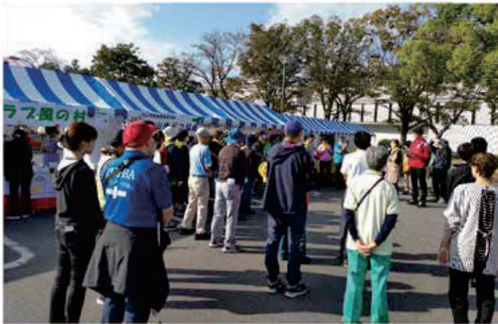
福祉会場の朝礼の様子。秋の空がとてもきれいです。