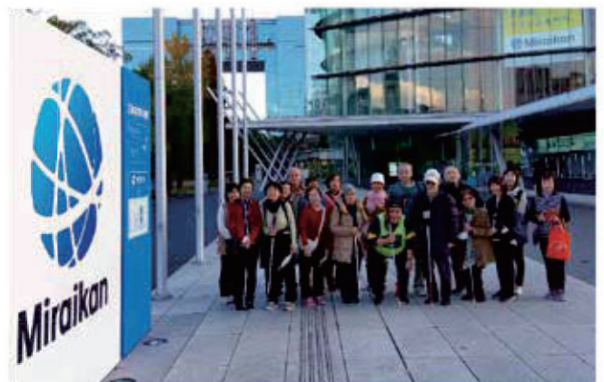
日本未来館にて集合写真。