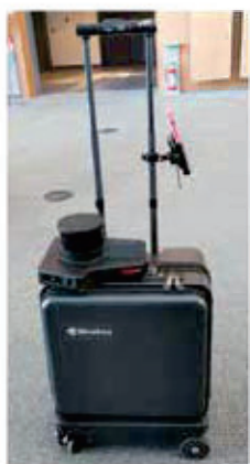
AIスーツケース。 とても頑丈そうです。