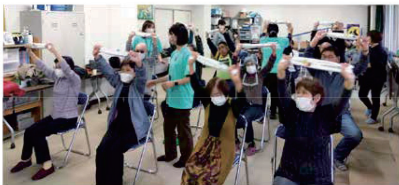
フレイル予防体操。

昼食は音声ガイド電子レンジを使用し、冷凍弁当を解凍し試食。 今後の冷凍食品の活用に期待。