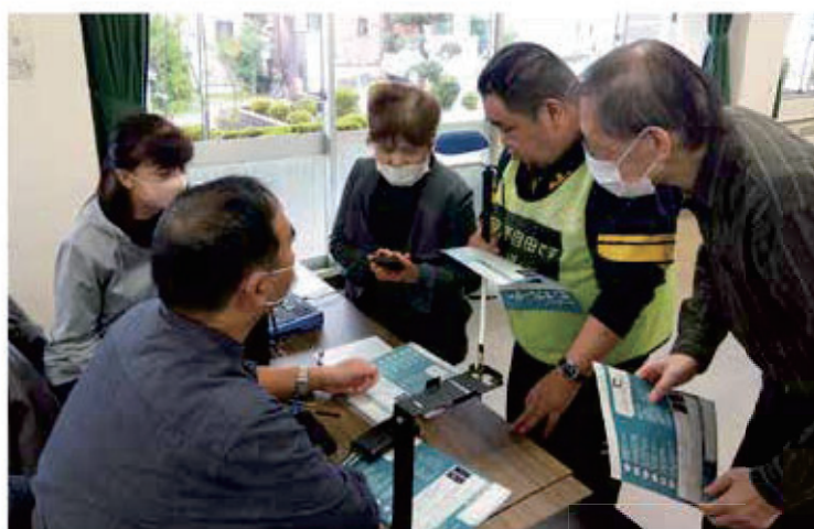
視覚障害者便利用具の説明を聞く。

昼食は音声ガイド電子レンジを使用し、冷凍弁当を解凍し試食。 今後の冷凍食品の活用に期待。