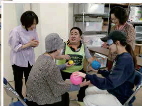
東京理科大学学生さんとのレクリエーション。 学生さんはアイマスクをしています。