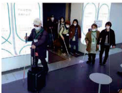
AIスーツケース体験の様子。