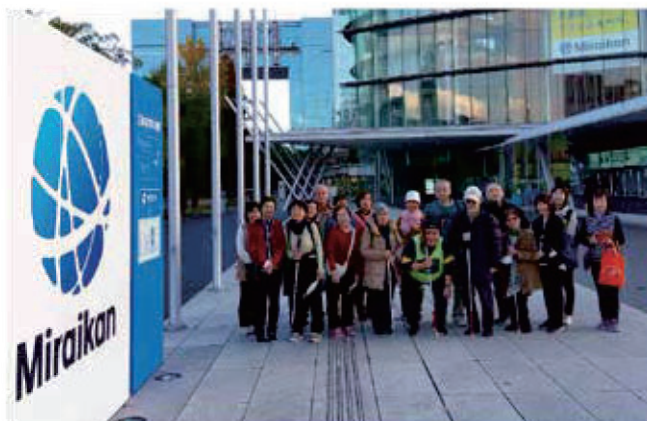
日本未来館にて集合写真。