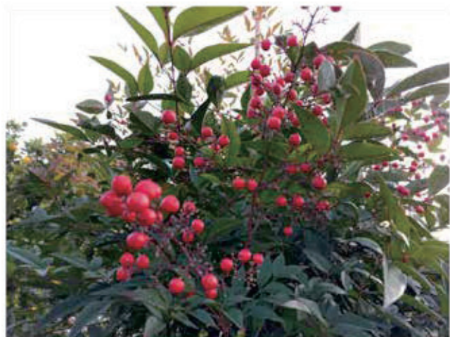
冬の寒い空に南天の赤い色がよく映えます。