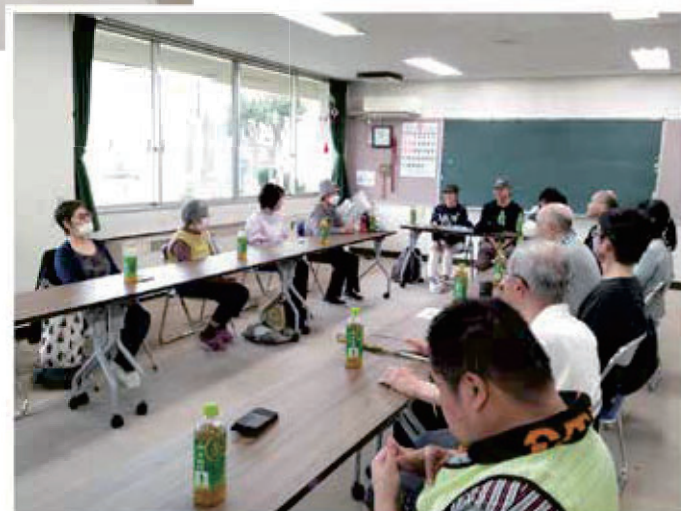
東京理科大学学生ボランティアサークルさんと会談の様子。