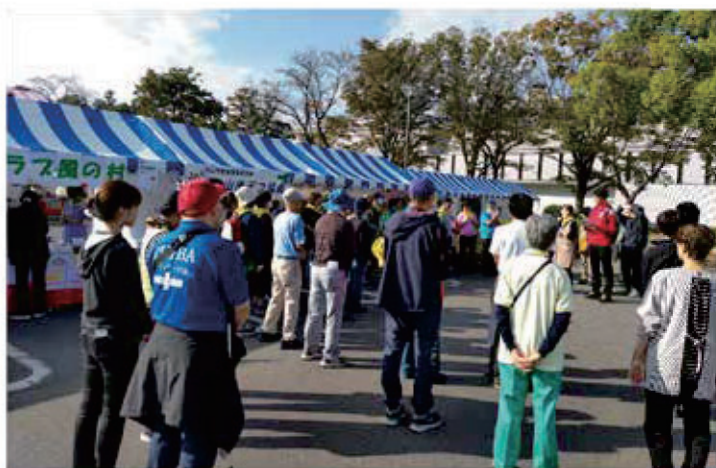
福祉会場の朝礼の様子。秋の空がとてもきれいです。