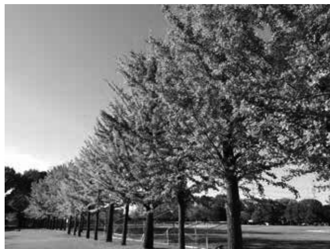
東京理科大学グラウンドのイチョウ並木 ほんのり色づきはじめてイチョウが秋の柔らかな日差しに照らされています。