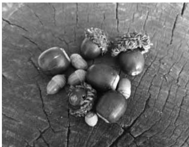
流山市立森の図書館隣の古墳公園で見つけた「秋」。どんぐりの季節になりました。