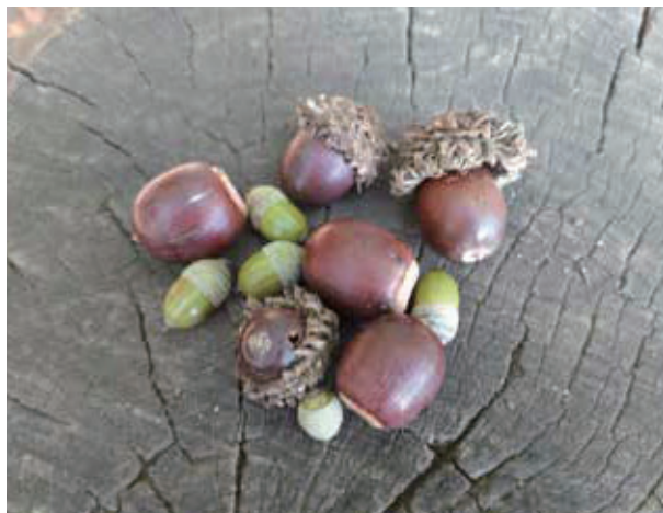
流山市立森の図書館隣の古墳公園で見つけた「秋」。どんぐりの季節になりました。