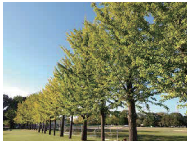
東京理科大学グラウンドのイチョウ並木 ほんのり色づきはじめてイチョウが秋の柔らかな日差しに照らされています。