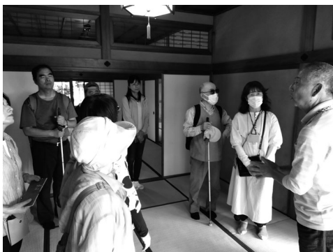
戸定邸内で案内ガイドの説明を受ける皆さん