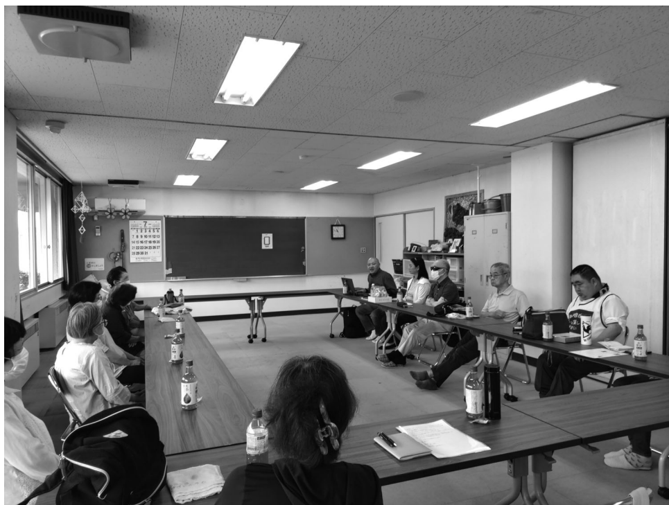
定例会全体の様子