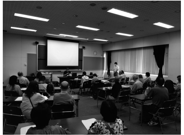
西部図書館研修室 後ろ姿も真剣です