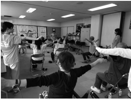
フレイル予防体操の様子①