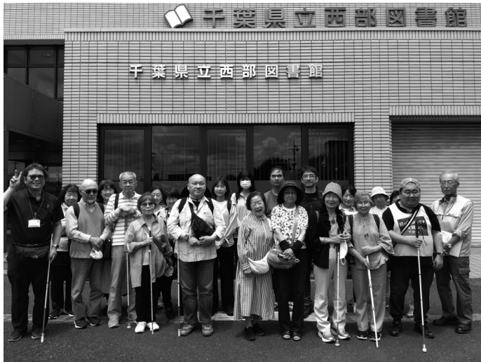
県立西部図書館前で全員集合