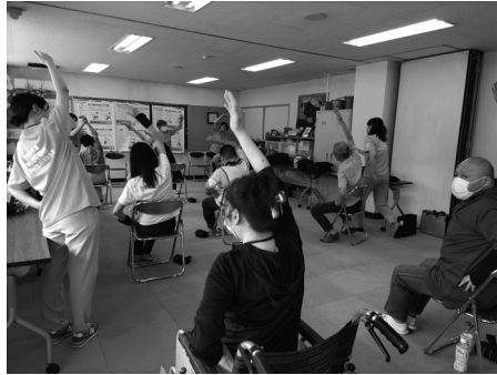
フレイル予防体操の様子②