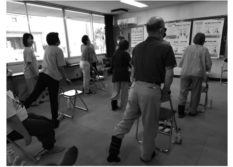
フレイル予防体操の様子③

午後は、高齢者支援課の講師から、フレイル予防には、社会参加・食事・運動が大切である旨の説明をいただきました。運動指導員からは、健康体操の指導を受けました。