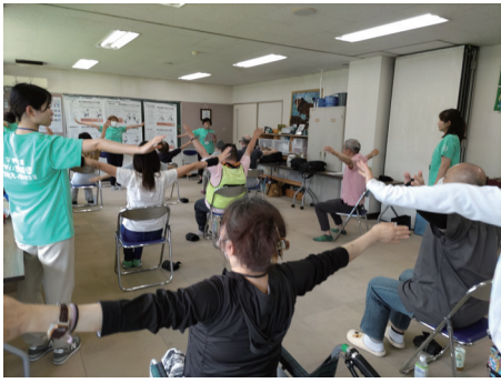
フレイル予防体操の様子①