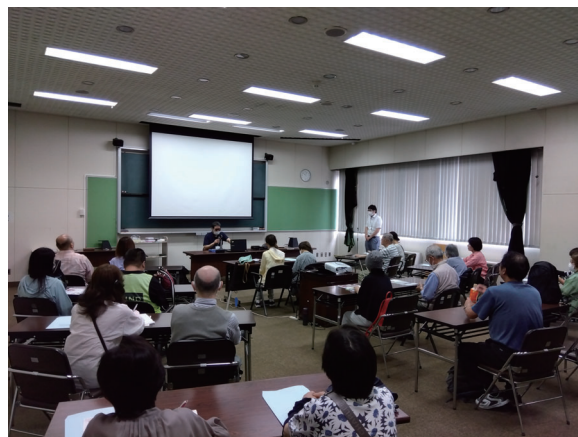
西部図書館研修室 後ろ姿も真剣です