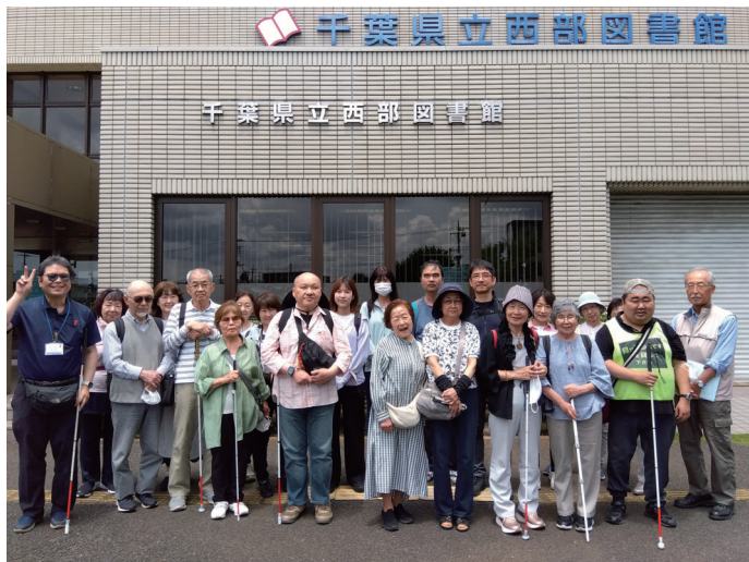
県立西部図書館前で全員集合