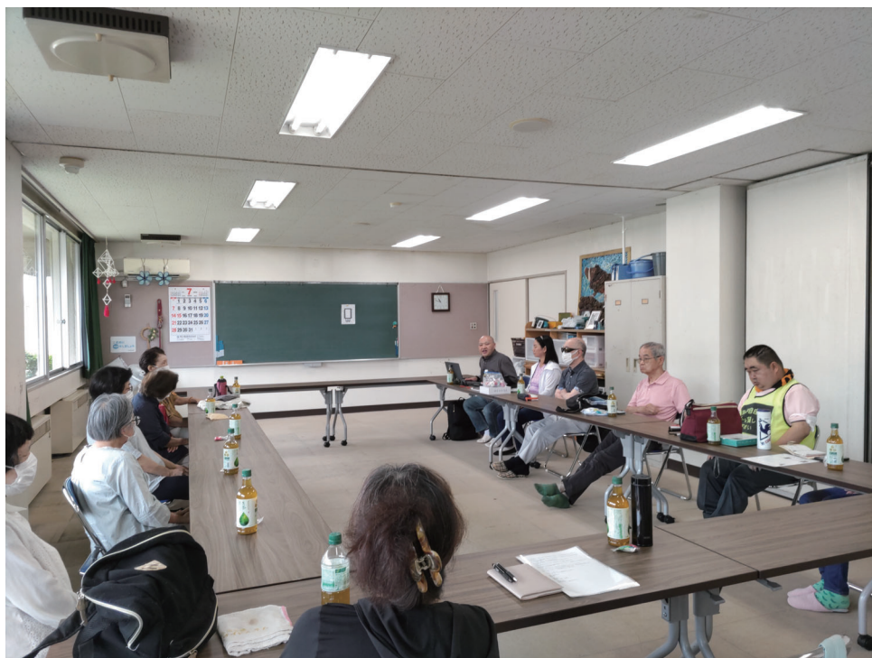
定例会全体の様子