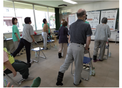
フレイル予防体操の様子③

午後は、高齢者支援課の講師から、フレイル予防には、社会参加・食事・運動が大切である旨の説明をいただきました。運動指導員からは、健康体操の指導を受けました。