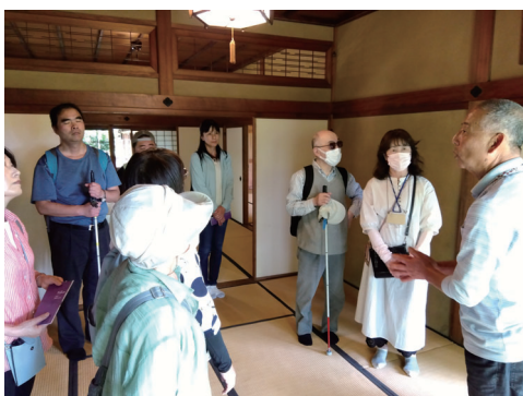
戸定邸内で案内ガイドの説明を受ける皆さん