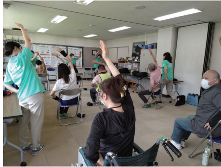
フレイル予防体操の様子②