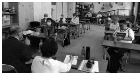
令和6年5月総会の様子

ITや生活補助具、高齢になつての将来の施設などの不安や課題があるとお声を多く伺いました。当会がこれからの要望として各所につなげていこうと力強く考える時間となりました。