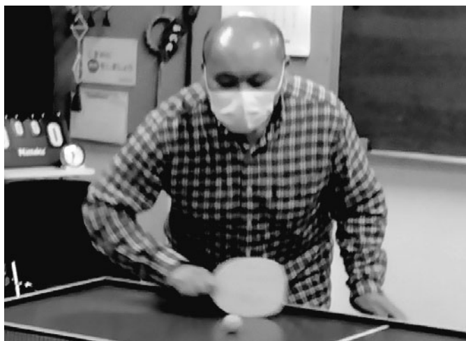
※写真は2月定例会でのプレイの様子です。